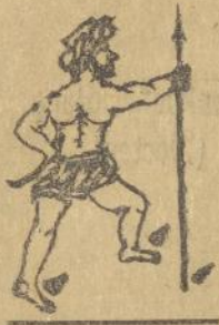
Molo matabohoe . . .

Ndang na so aong bahenon ni App. boeaton ni bodil laho mambahen toedosan toe halak na porloe paingotonna. Ai marhite toedosanna i dihlala be na niolalahonna siganoep ari.