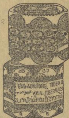
Dalem goetji kecil merah dan poeti

Obat tjap Matjan tida boleh tida ada di toean poenja roemah, kerna tida ada obat lebih baek boeat semboehken Rheumatiek, sakit boekoe toelang dan spier, kasaleo dan pilek dari pada ini obat oemoem. Djoega boeat laen-laen penjakit dan ganggoean obat tjap Matjan ada mandjoer. Tjeba soeroe toean poenja boedjang beli boeat satalen satoe goetji ketjil Obat Matjan. Toean pasti aken dapet kafaedahan dari ini.